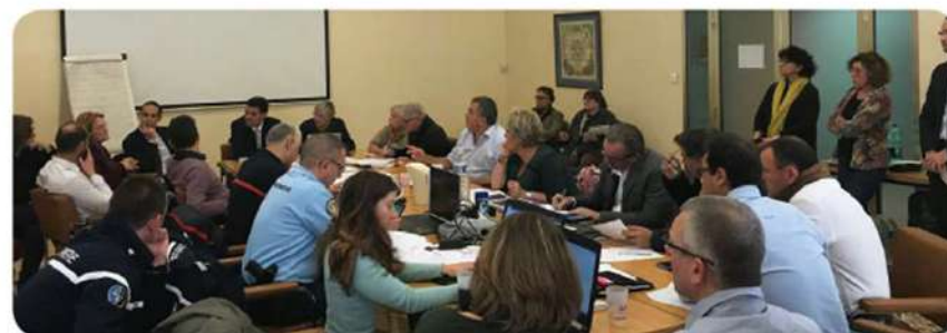
Le PCC en action