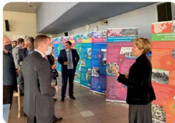
Exposition AFPS lors de la commémoration du séisme du Teil le 11 novembre 2020.