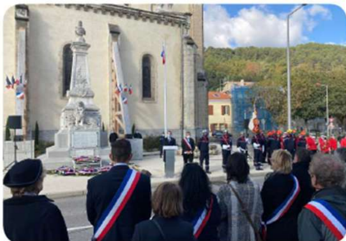
Commémoration du séisme du Teil le 11 novembre 2020.