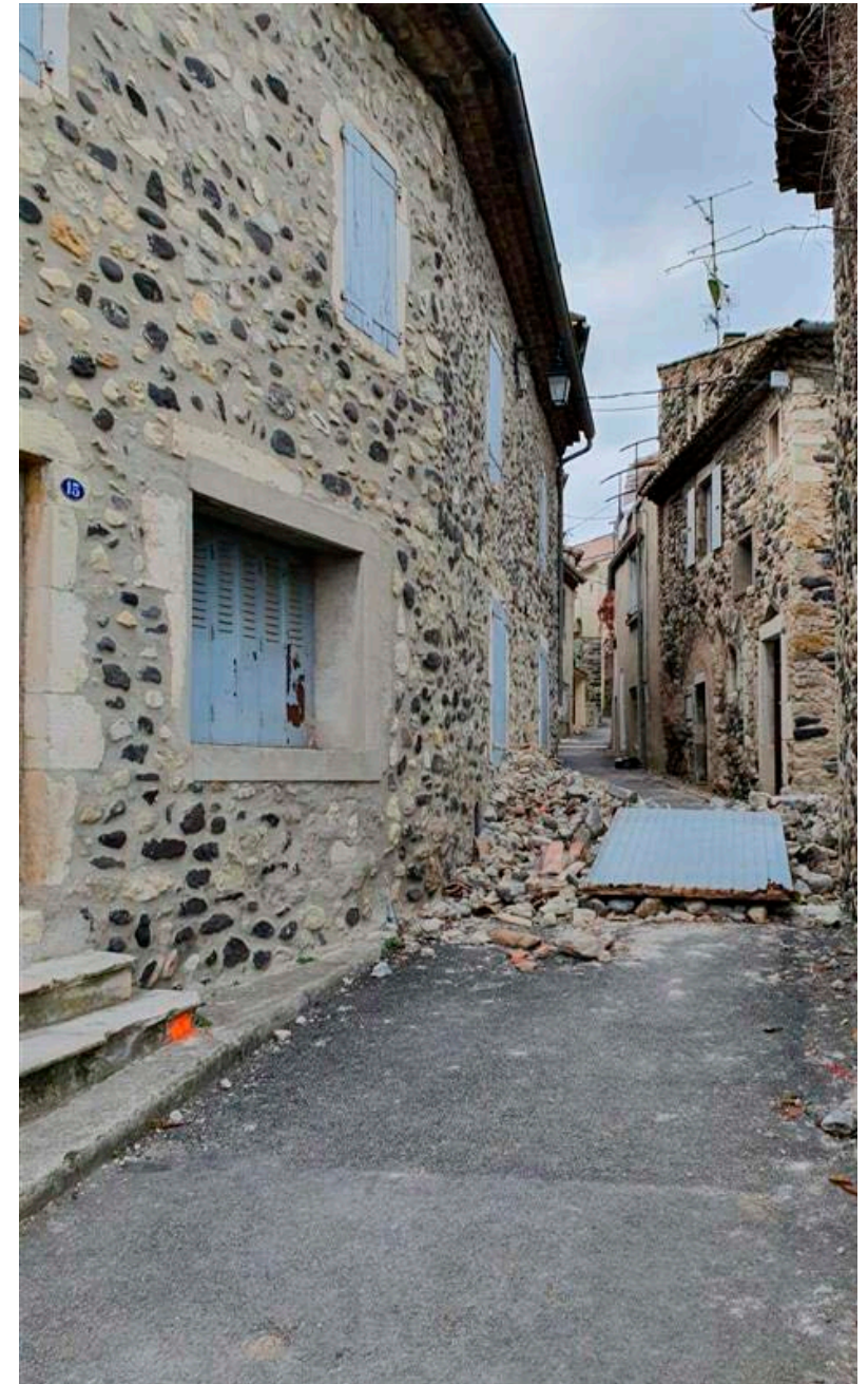
Calle de Le Teil después del terremoto del 11 de noviembre de 2019

Durante el acto se ofrecerá interpretación simultánea francés <-> castellano»